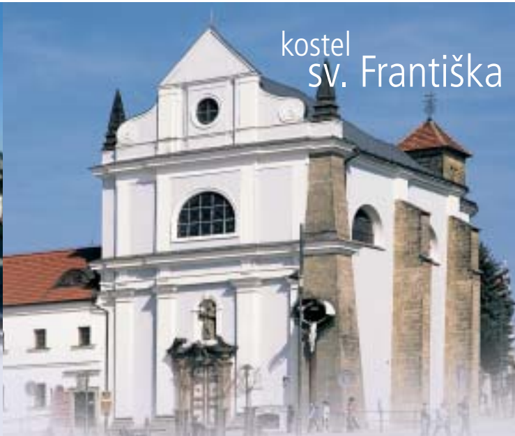
kostel sv. Františka

Kostel sv. Františka z Assisi stojí v horní části náměstí Českého ráje. Byl spolu s klášteřem postaven v polovině 17. století Maxmiliánem z Valdštejna. Kostel dvakrát vyhořel. Svou nynější podobu získal díky přestavbě v letech 1803 - 1825. Nejstarší stavbou na Turnovsku je kostel sv. Jana Křtitele v městské části Nudvojovice. Byl postaven na přelomu 12. a 13. století. V roce 1894 byl novogoticky upraven, zachován zůstal původní románský portál. Nad městem je zdaleka viditelná stavba kostela sv. Matěje na Hrušticích . Původně gotická stavba byla naposledy upravena v r. 1894. V Krajčířově ulici se nachází synagoga , jediná, která přežila nacistickou okupaci v Čechách. Poblíž, stísněn stavbou silničního průtahu, je židovský hřbitov s nejstaršími náhrobky ze 17. století. Městské informační středisko nabízí prohlídky kostelů a dalších památek města. V letní sezóně probíhají pravidelné prohlídky každé pondělí odpoledne.