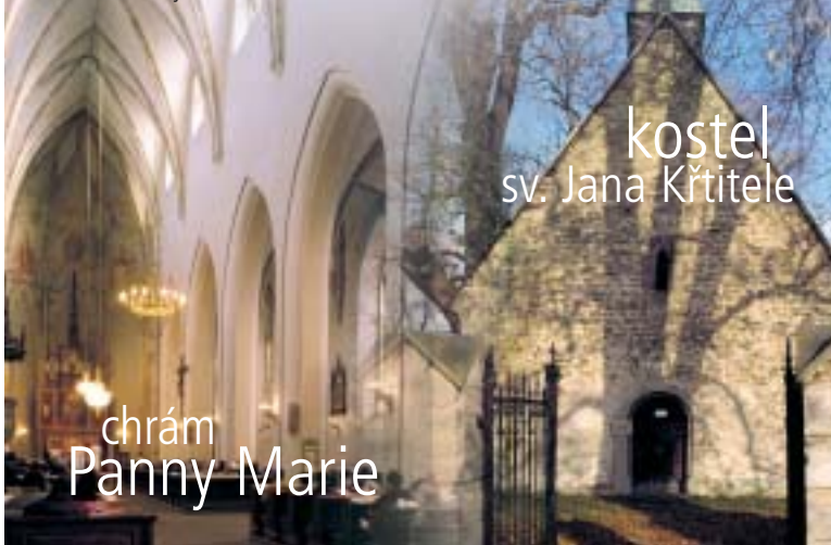
chrám Panny Marie

Panorama města tvoří věže kostelů. Dominantou je typická, vlastně nedostavěná věž chrámu zasvěceného Panně Marii . Mohutná trojlodní novogotická bazilika byla stavěna v období 1825-53 na místě, kde stával gotický klášter založený ve 13. stol. údajně Zdislavou z Lemberka. Přes údolí Jizery je dobře viditelná též barokní věž kostela svatého Mikuláše . Kostel původně gotický ze 14. století, byl po požáru přestavěn renesančně a později roku 1722 barokně. Uvnitř chrámu jsou kamenné náhrobky rodu Vartemberků.